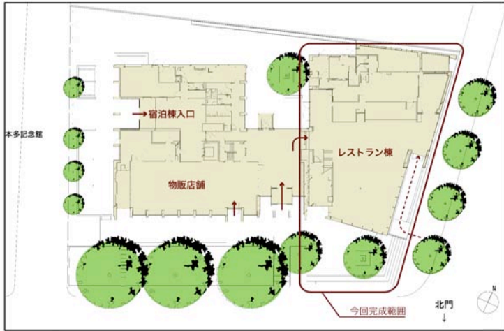
Site Plan S=1:800