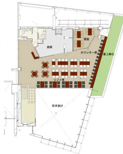
2F Plan S=1:400